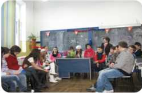
Organizarea Serbării de Crăciun ;