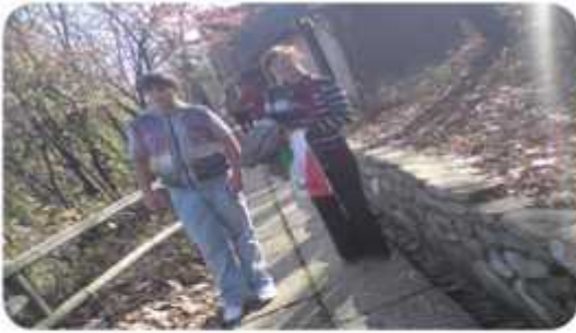
Excursie la Muzeul satului și Muzeul Țăranului Român;